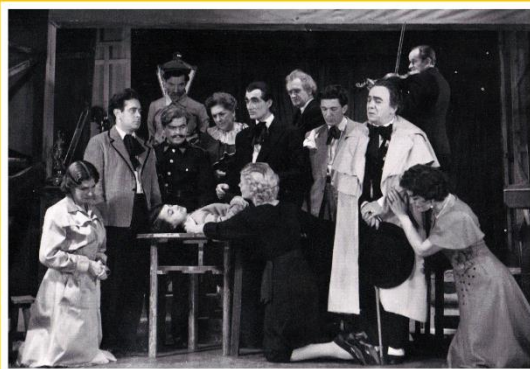
„GLUMCI I RODE”, u produkciji NP Mostar sezona 1959/60