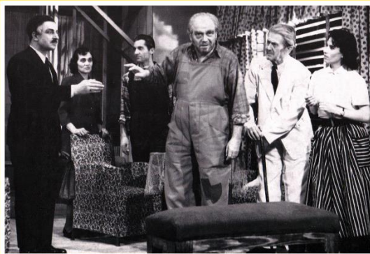
„DRVENI TANJIR”, u produkciji NP Mostar sezona 1958/59